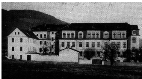
Domov sv. Josefa v Krupce