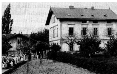
Domov sv. Josefa v Maršově