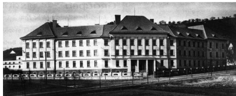
Druhý domov sv. Josefa v Mostě