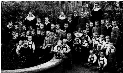
Na zahradě prvního domova v Mostě