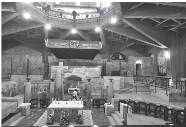
Bazilika Zvěstování Panně Marii v Nazaretě. Jak napsal ve svém poselství k Vánocům roku 1963, Pavel VI. svou pouť na místa spjatá s Ježíšovým živo- tem pojímal jako svědectví: vyznání své víry v Krista a své lásky k němu.