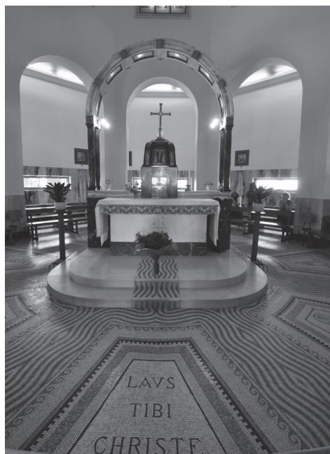
Oltář v kostele Blahoslavenství